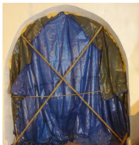
Afdækning til kor