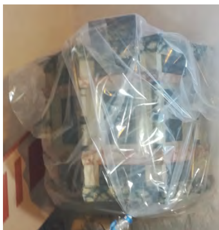
Afdækning af prædikestol

Vi glæder os meget til at se det endelige resultat og fylde kirken med alle vores ting og se menigheden igen søndag d. 8. oktober.